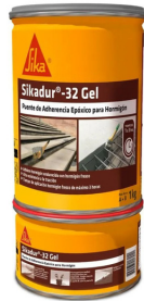
Adherente Epoxico Sikadur 32

Ofrecen soluciones de alta adherencia para colocar cerámicos, porcelanatos y azulejos .